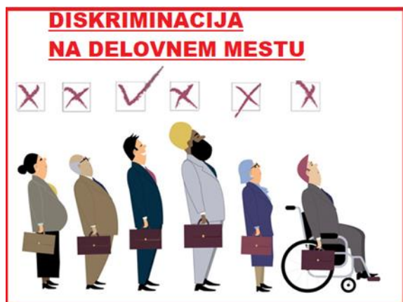
Slika 1: Korak naprej (vir: WordPress.com ,2022)

»Biti drugačen – pomeni, da se ne bojiš biti takšen, kot si.« ( vir: pozitivnamisel.com)