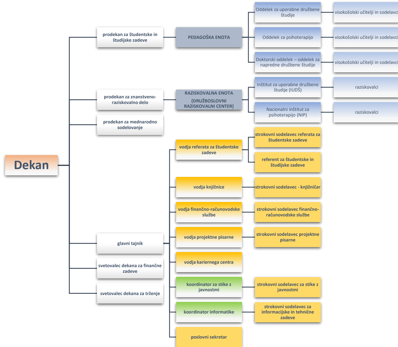
Graf 4: Organigram fakultete