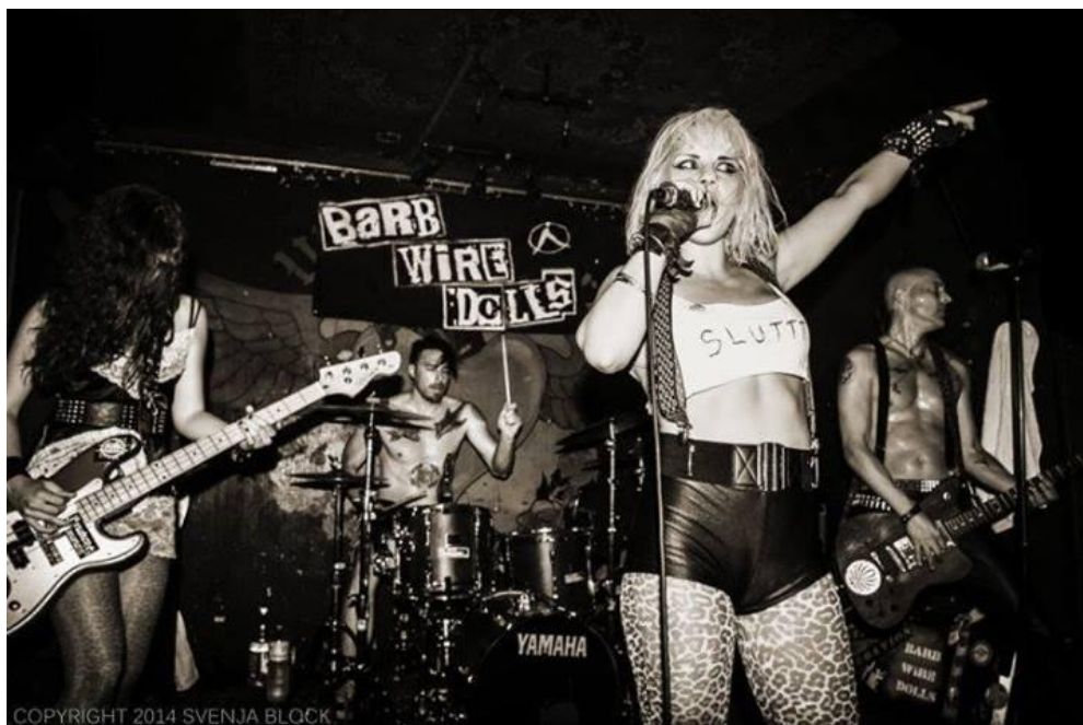
Slika 3.2: Skupina Barb Wire Dolls