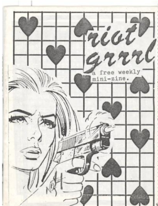
Slika 3.3: Fanzin Riot Grrrl